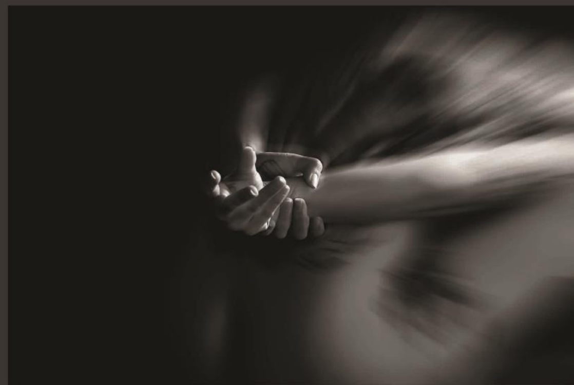
R u m o r o s o s i l e n z i o