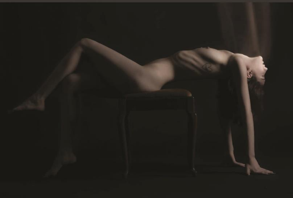
D a i m o n