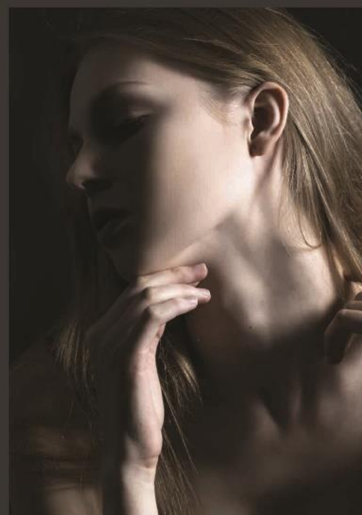
L a d y